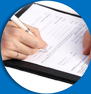
AUDITORÍA DECRETO 1072 SG-SST