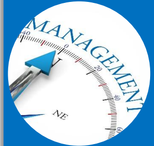
GERENCIA DE RIESGOS Y PELIGROS

Inspección de Herramientas y Equipos, Actividades Críticas Rutinarias y No Rutinarias, Inspección Gerencial & Riesgos Prioritarios