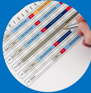
PROCEDIMIENTOS Y PROTOCOLOS DE SEGURIDAD Y SALUD EN EL TRABAJO