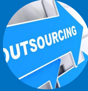
OUTSOURCING DE PROCESOS HSE Y PESV